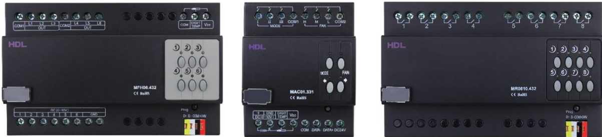
Topení – ovládání elektrických hlavic Ovládání klimatizace Ovládání ventilátorů, vrat, čerpadla