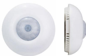
Stropní interiérový senzor 7 v 1