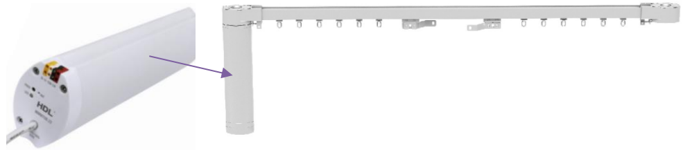
Ovládání motorů závěsů