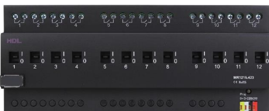
Relé pro zásuvky