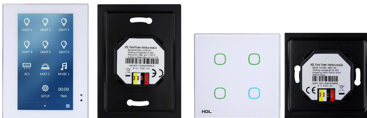
Ovládací panel Enviro a sběrniceová spojka

(Pozn. Výhodou uvedených ovládacích panelů je integrované měření teploty v místnosti ve výšce 1,2 m.)