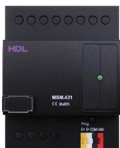
Ovládání bezpečnostního systému

(Pozn. Výhodou uvedených senzorů je integrované měření teploty v místnosti v úrovni stropu.)