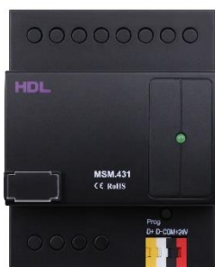
Ovládání bezpečnostního systému