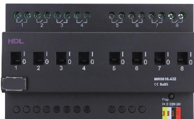
Relé pro zásuvky