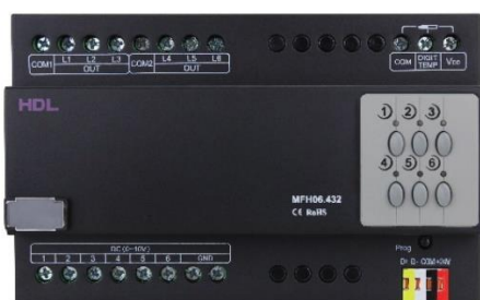
Topení – ovládání elektrických hlavic

Termoelektrické pohony hlavic nejsou součástí kalkulace.