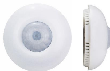
Stropní senzor 7 v 1