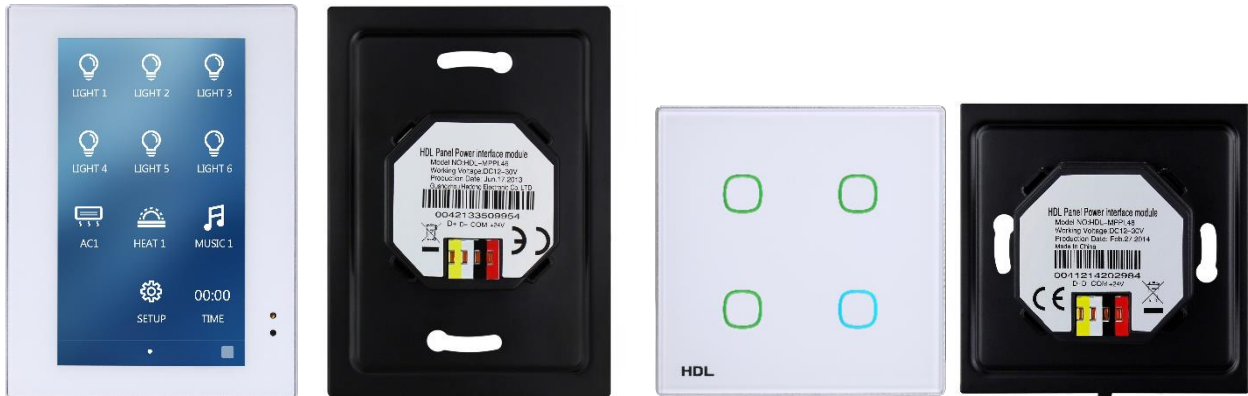
Ovládací panel Enviro a sběrnicová spojka

(Pozn. Výhodou uvedených ovládacích panelů je integrované měření teploty v místnosti ve výšce 1,2 m.)