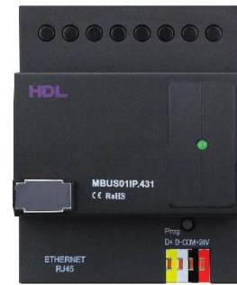
Zdroj pro napájení sběrnice systému 750 mA resp. 2,4 A