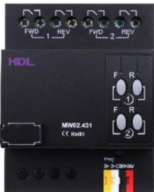
Ovládání motorů žaluzií