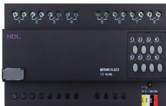
Relé pro osvětlení