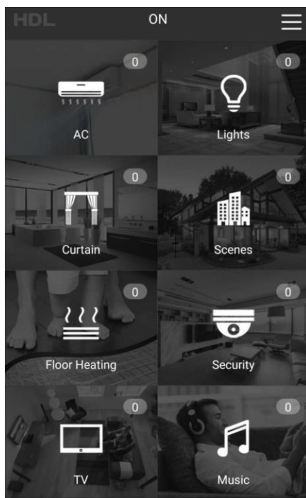
Aplikace HDL ON

HDL ON a Myjordomus jsou určeny pro mobilní telefony a tablety. Aplikace lze instalovat jednak na OS Android a také na iOS. Mohou komunikovat lokálně po místním Wi-Fi nebo v případě vzdáleného přístupu po Internetu. Proto musí být k Internetu připojeno jak mobilní zařízení s aplikací, tak i Ethernetová brána Buspro. Obě zařízení se budou připojovat ke cloudovému serveru. Připojení v tomto režimu umožní ovládání odkudkoliv a kdykoliv. Aplikace Myjordomus navíc používá šifrovanou komunikaci a řízený přístup pomocí bezpečnostních certifikátů, podobně jako v bance.